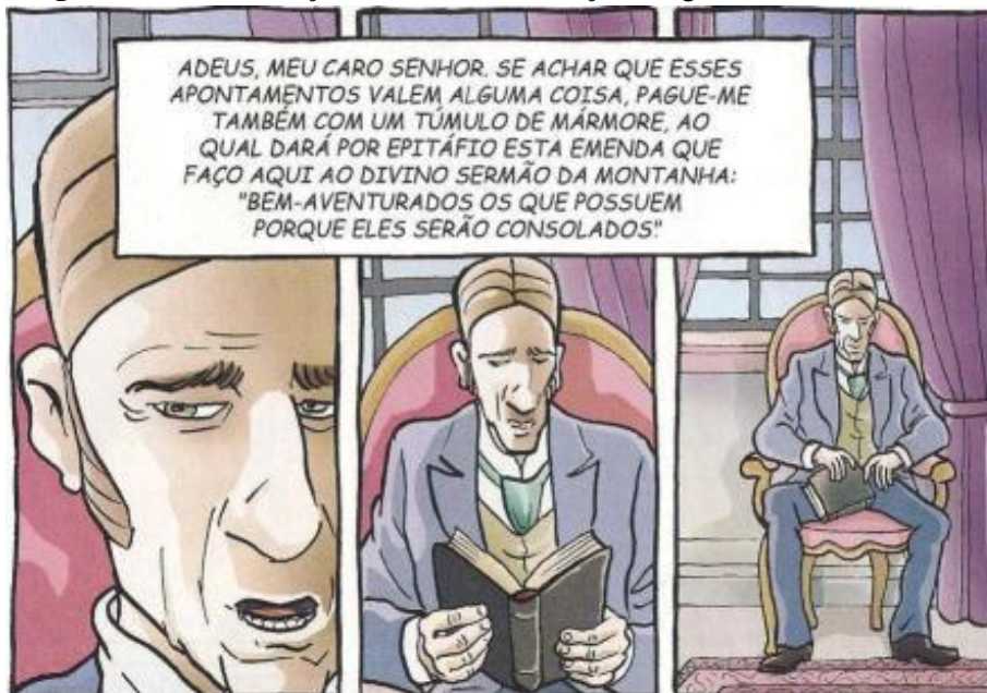
Figura 04: Reconstrução da bem aventurança evangélica