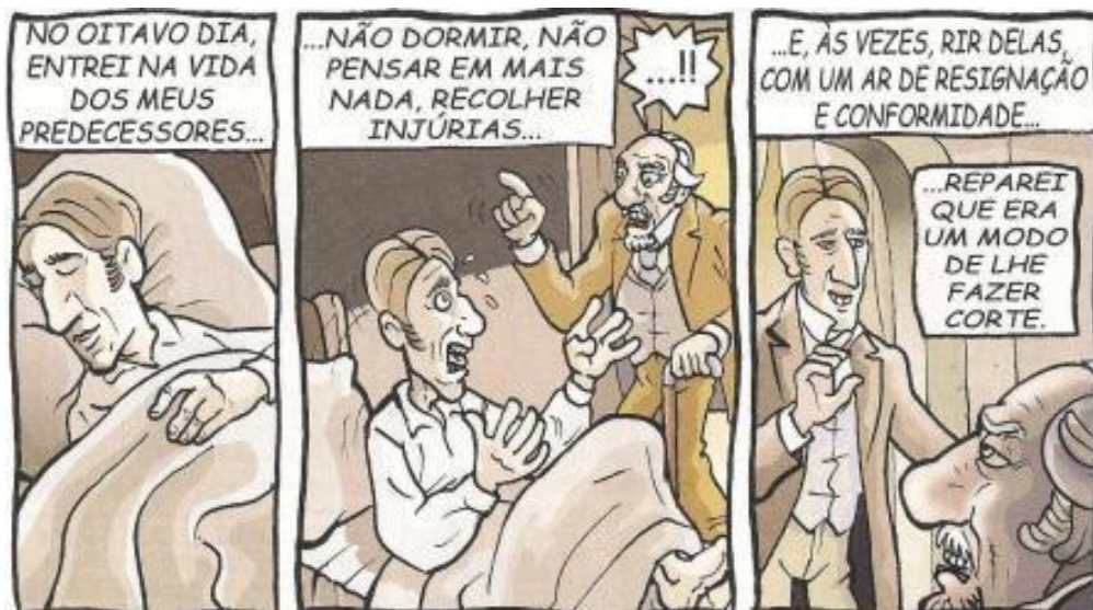
Figura 03: Procópio sofre as agruras do coronel

Procópio, nos sete primeiros dias, viveu uma perfeita lua de mel com o coronel. A partir do oitavo, entra na vida dos seus predecessores (figura 03). De acordo com Poe (1965, p. 27) “o conto precisa causar um efeito singular no leitor: muita excitação e emotividade”. E a narrativa em evidência estimula o leitor para tais sensações. Isso ocorre pelo fato de que Machado de Assis ao explicar um fato, consegue fazê-lo com exímio brilho e atração. De maneira que a cada página passada, a tensão e o suspense se intensificam até porque se sublinha as características psicológicas dos personagens. E a adaptação, em parte, ilustra estas peculiaridades dos personagens, pelas estratégias de criação presentes.