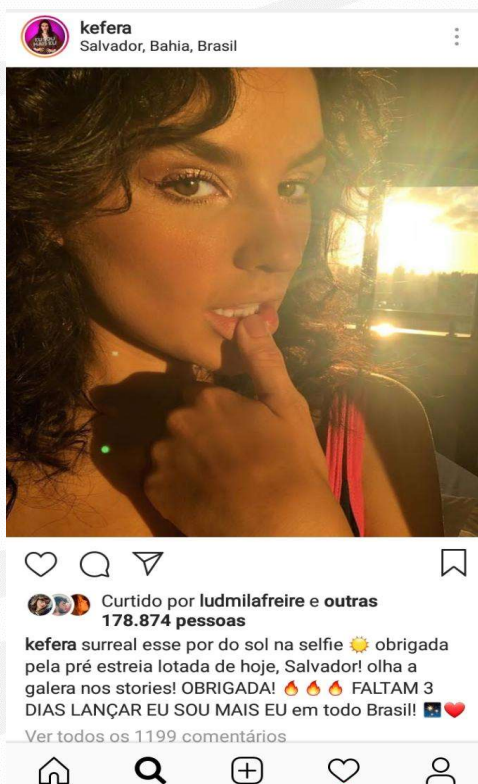
Figura 1: Publicação 1 – Kéfera

Fonte: Instagram Kéfera. Disponível em: https://www.instagram.com/p/Bs6uQ9oHw20/?utm_source=ig_share_sheet&igshid=1wst8bw8a2t3 . Acesso em 01 fev. 2019.