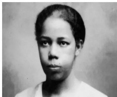
Antonieta de Barros (Foto 1: Portal G1/2016)

deputada estadual negra do país e a primeira mulher a ocupar uma cadeira na Câmara Estadual dos Deputados de Santa Catarina.