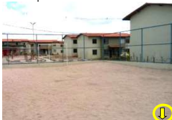
Figura 03: Conjunto habitacional “Portal da Princesa” . Equipamento urbano que passa a compor a paisagem da Gabriela a partir de 2000.

conjuntos habitacionais do programa do governo Federal “Minha Casa, Minha Vida”, o conjunto Solar da Princesa e Portal da Princesa (Figura 03)