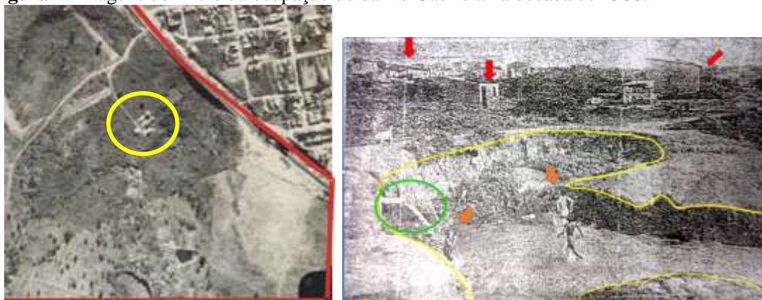
Figura 1: Imagens do início da ocupação do bairro Gabriela na década de 1980.

Na figura 1, em destaque de amarelo à esquerda, é a área onde se deu o início da ocupação do bairro. À direita, uma foto ao nível do chão da mesma área da foto aérea. Em destaque, de amarelo, a área da Fonte dos Milagres. Em vermelho, as primeiras casas que foram construídas. Nota-se alguns moradores tomando banho na nascente denominada Fonte dos Milagres.