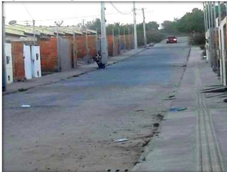
Figura 04: Ruas pavimentadas do Residencial Alvorada

O Residencial Alvorada é o sexto conjunto habitacional da cidade de Serrinha e foi implantado em 23 de Dezembro de 2016 com 492 residências. Está localizado no Bairro Princesa do Agreste, que antes era área rural, fator que foi considerável para a especulação imobiliária uma vez que sendo espaço rural, ganha outras formas com a chegada do residencial como podemos observar na figura 02. Isso reflete em vários segmentos sociais, como os tributos que eram Instituto Nacional de Colonização e Reforma Agrária - INCRA passa a ser Imposto Predial Territorial e Urbano- IPTU, passa a ter coleta de lixo, infraestrutura pois as vias são todas pavimentadas como podemos observar nas figuras 04 05 e para os proprietários das terras isso ganha um outro aspecto que deixam de vender em tarefas para vender em lotes.