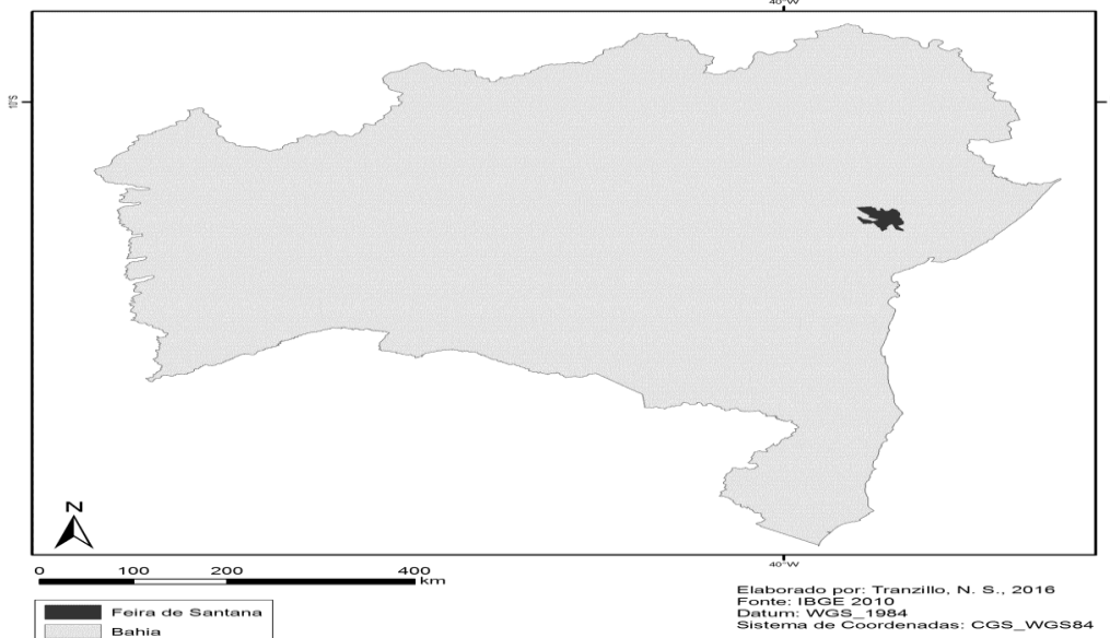
MAPA 01 – FONTE: Trazilo, – adaptado pelos autores.

O Município de Feira de Santana, considerado um dos maiores do estado Bahia possui um Centro Industrial do Subaé (CIS), criado com o objetivo de congregar algumas atividades econômicas que até então se concentravam no centro da cidade. De acordo com a Associação Comercial e Empresarial de Feira de Santana (ACEFS), o município possui um quantitativo crescimento significativo de empresas, o que é considerado como a criação de trabalho formal. A figura 01 mostra o número de empresas com registros jurídicos no ano de 2013.