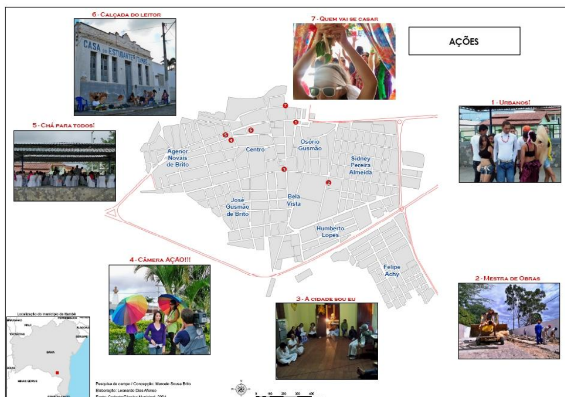
Figura 2 – Ações

Amar e defender a cidade foram os sentimentos que os itambeenses mais expressaram durante a realização desta pesquisa. Mesmo diante do descaso do poder público e da falta de perspectivas, os moradores de Itambé continuam depositando e investindo esperança no futuro deste lugar querido por eles, fazendo interagir cidadania e cultura, como propunha Milton Santos (1993). Depois de meses envolvido neste projeto, estimulando reflexões, debates e encontros, portas e janelas foram e, acredito, serão